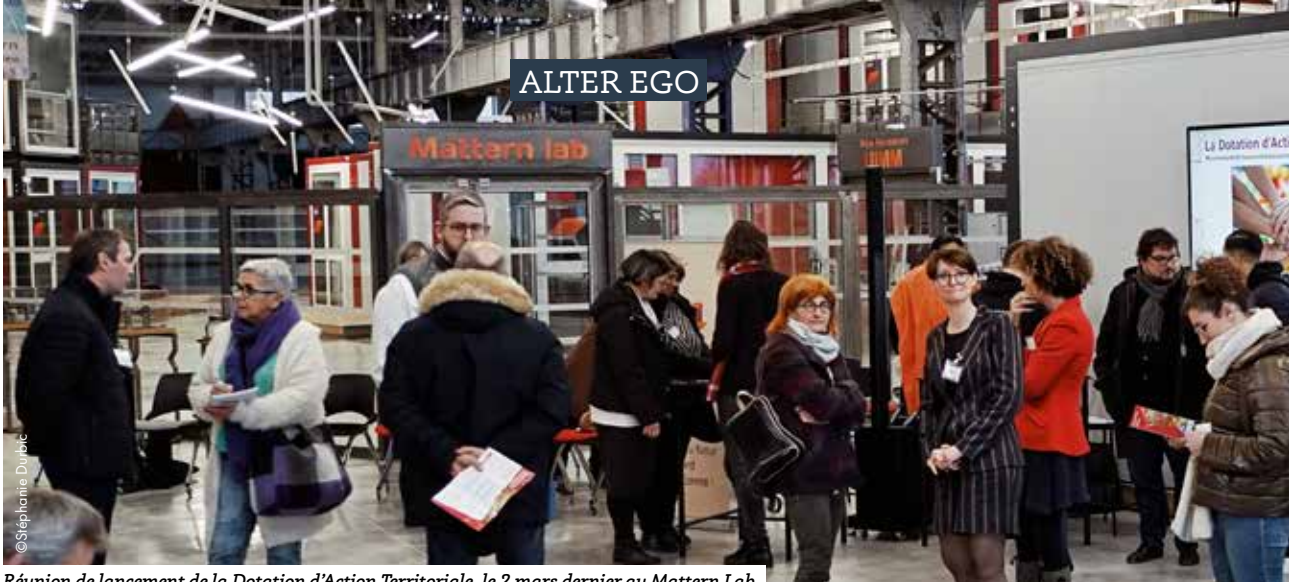
Réunion de lancement de la Dotation d'Action Territoriale, le 2 mars dernier au Mattern Lab.