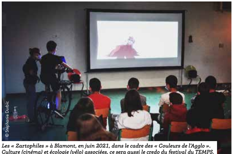
Les « Zartophiles » à Blamont, en juin 2021, dans le cadre des « Couleurs de l'Agglo ». Culture (cinéma) et écologie (vélo) associées, ce sera aussi le credo du festival du TEMPS.