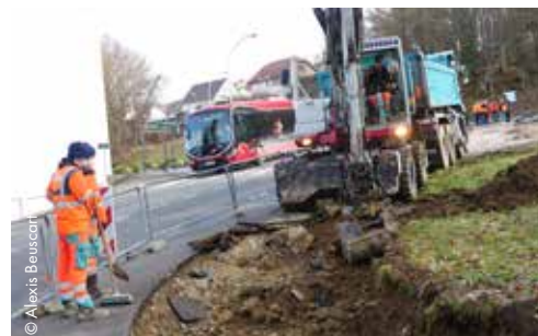
En janvier débutent les travaux de la ligne 3 à Hérimoncourt. ■