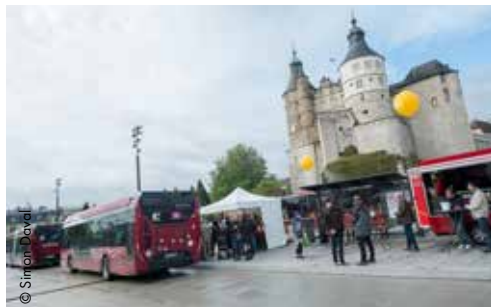
Fin des travaux sur Montbéliard et inauguration, le 27 avril, du nouveau réseau evolitiY. ■