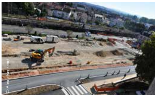
En septembre débutent les travaux sur l'Acropole à Montbéliard, ainsi que rue de la Schliffe. ■