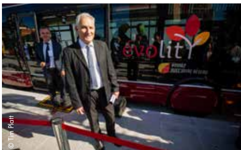
PMA démarre en janvier son service de Signalisation Lumineuse Tricolore qui donne la priorité aux bus aux carrefours à feux. En octobre, les bus articulés Créalis d'Iveco sont présentés au public (photo). Motorisés au Gaz Naturel pour Véhicules (GNV), ils nécessitent la construction d'une station gaz à Voujeaucourt. ■