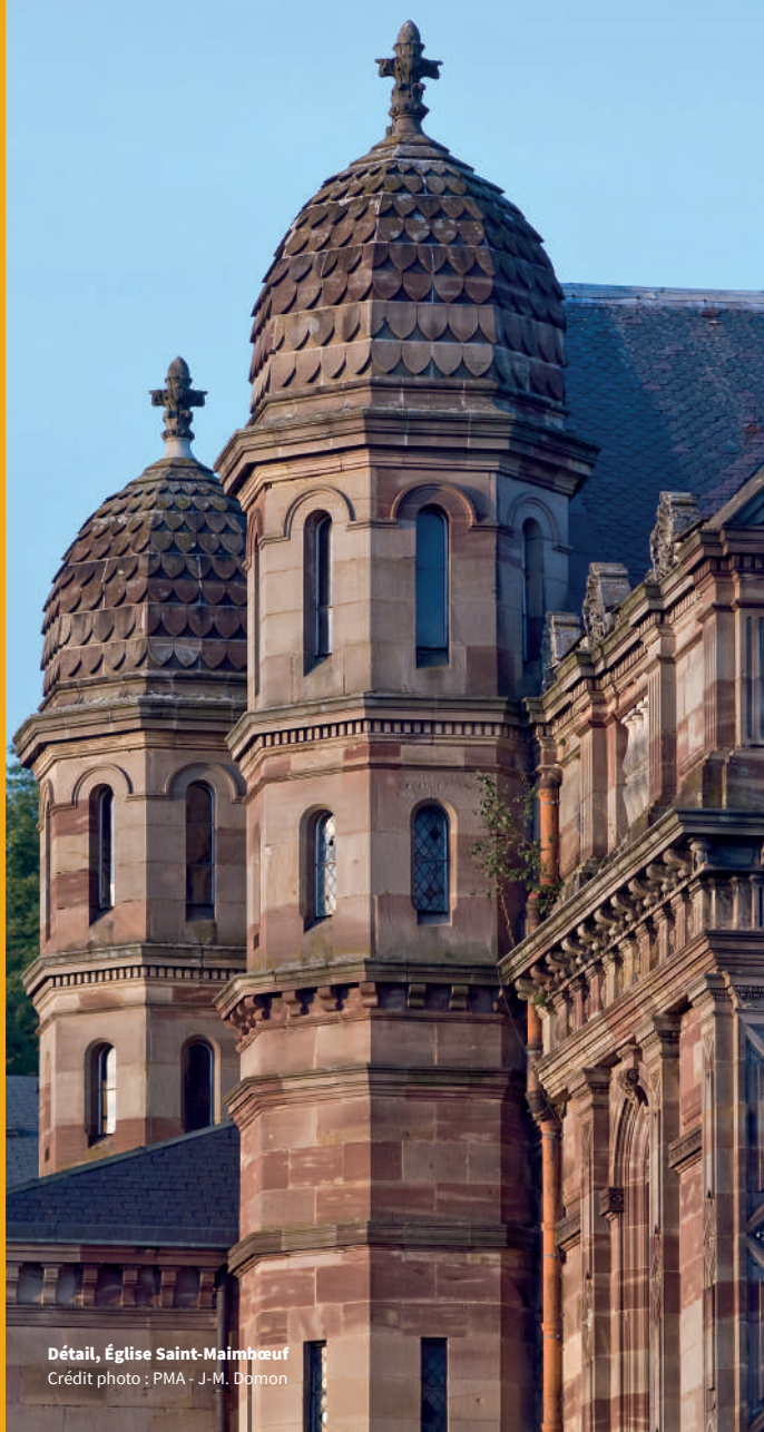
Détail, Église Saint-Maimboeuf