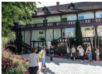
Centre-ville historique de Montbéliard

Réservation obligatoire au 03 81 31 87 80 ou sur agglomontbeliard.fr